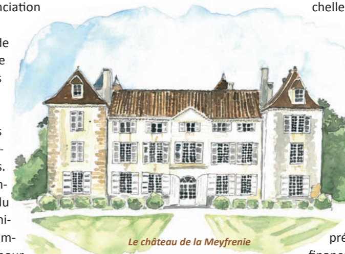
Le château de la Meyfrenie

Délégué départemental Délégué régional «Nouvelle Aquitaine»