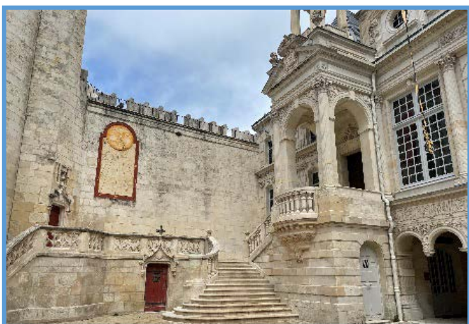
Hôtel de Ville et son pavillon Renaissance

Le mur d'enceinte crénelé, les tourelles d'angles, l'échauguette dans laquelle était nichée la statue en