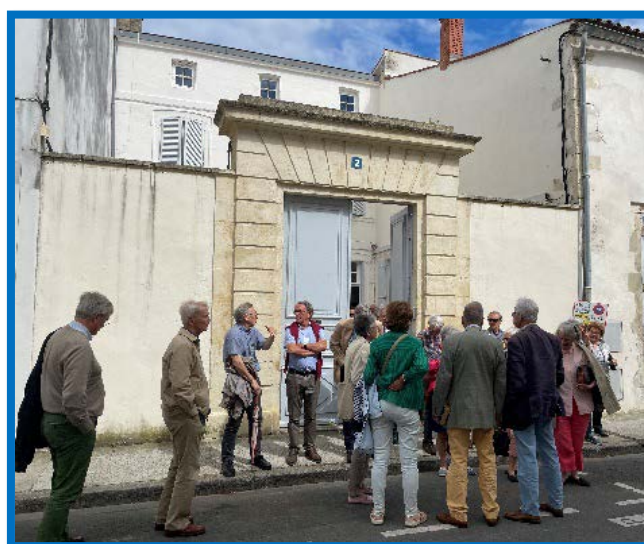
Devant l'hôtel de Lambertz

Situé 2, rue Galliéni, cet hôtel fut construit en 1737 ; racheté en 1772 par Jacob Lambertz, né à Brême, il