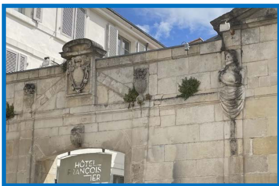
Hôtel Chastaigner de Cramahé

Emmené par notre guide, nous parcourons quelques rues pour découvrir dans la rue Bazoges, l'hôtel Chastaigner de Cramahé, au numéro 13-15, actuel hôtel de voyageurs François 1 er , dont il ne reste du temps de sa