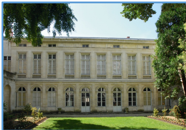
Aile de l'hôtel Fleuriau

Nous apercevons au travers des grilles du jardin de l'aile de l'hôtel Fleuriau, construite en 1780. D'ins-