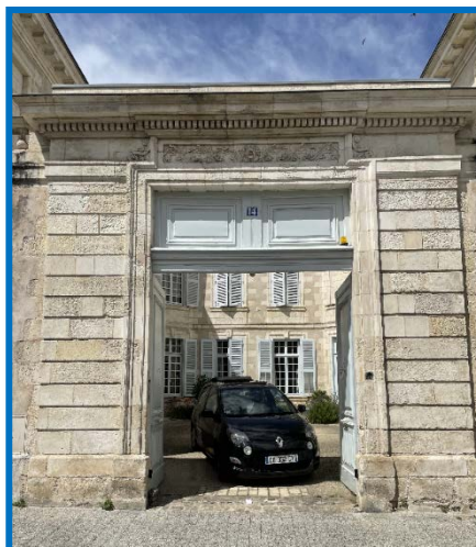
Hôtel Carré de Candé

Face à lui, l'hôtel Carré de Candé, au numéro 14, fut