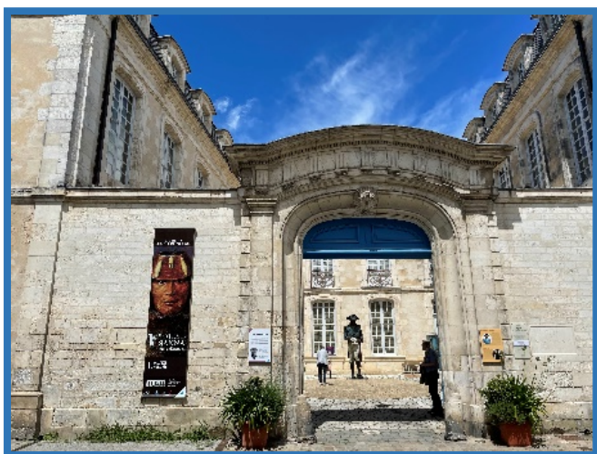
Hôtel de Fleuriau

Descendus du car place de Verdun, nous rejoignons à quelques centaines de mètres de là la rue Fleuriau et