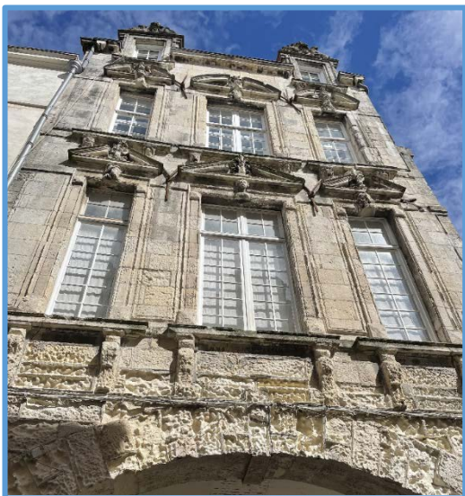
Maison au n° 8 de la rue

Sa voisine de face au n° 8 de style également Renaissance aux fines sculptures et aux magnifiques lucarnes n'a pas été épargnée par les ans.