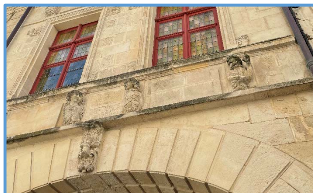
Maison aux personnages, rue des Merciers

Nous pouvons admirer en levant la tête deux façades de maison qui se font face. Celle dénommée maison aux personnages comporte à la clé de l'arcade une gerbe de blé et au-dessus quatre personnages (le quatrième personnage est hors champ de la photographie sur la gauche).