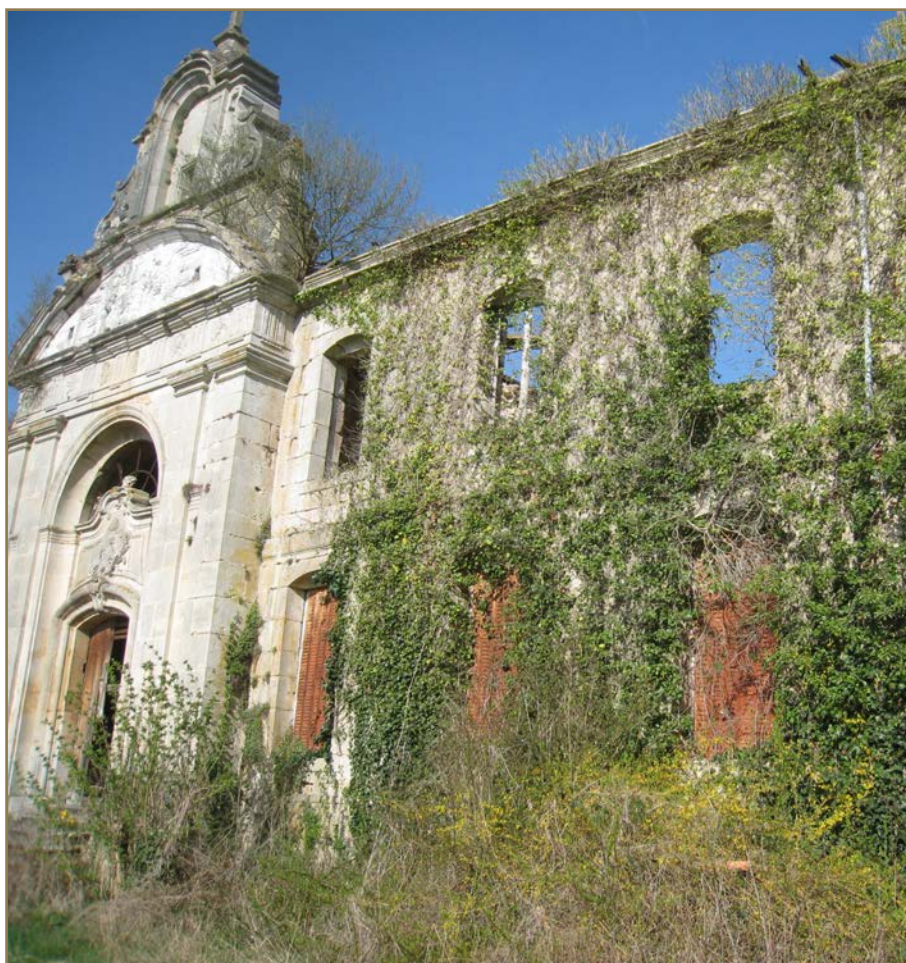
Abbaye Notre-Dame de l'Etanche en Meuse