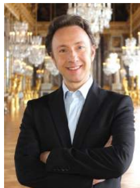
Monsieur Gabriel de Broglie, Chancelier de l'Institut de France lors de son discours d'accueil.